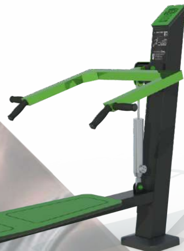
FIT X 2 BENCH PRESS