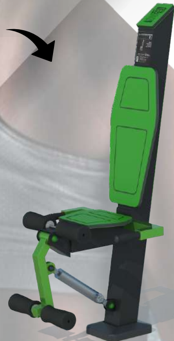
FIT X 5 LEG EXTENSION