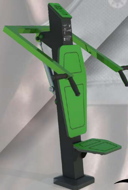
FIT X 6 SHOULDER PRESS