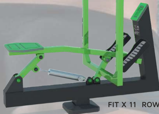
FIT X 11 ROWING

Hidráulico com regulação de peso 100 /200kg. Tubo quadrado 120 x 3 metalizado e lacado. Tubo quadrado 45 x 3 metalizado e lacado. Plástico tricolor 19mm, UV Apoio de joelhos e ombros em borracha. Placa informativa gravada a Laser. Garantia: Máquina 5 anos, Hidráulico 1 ano. Observação: Caixa com batente de borracha para não forçar hidráulico. Porcas anti roubo. Verde (6018) e Preto Mate Modelo Registado por: Veco Urban Design